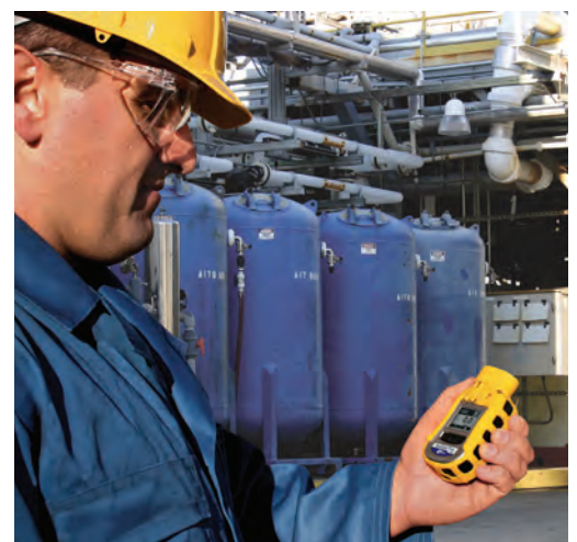
Surveillance de l'exposition des travailleurs avec le ToxiRAE Pro PID sur un site de production de PVC